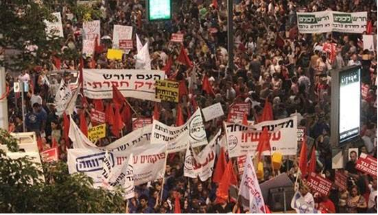
المظاهرة المليونية