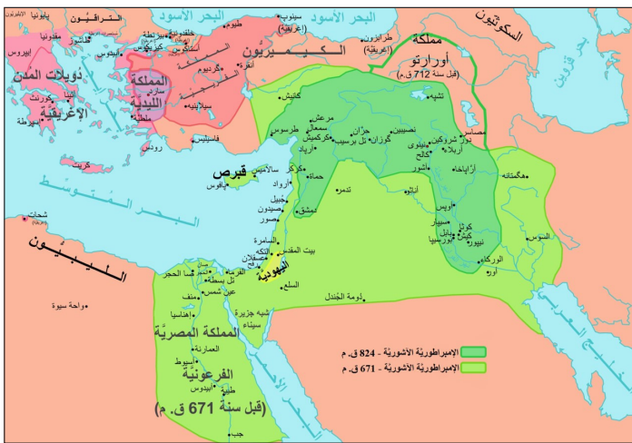
شكل 3: الإمبراطورية الآشورية في أقصى توسع لها الـ