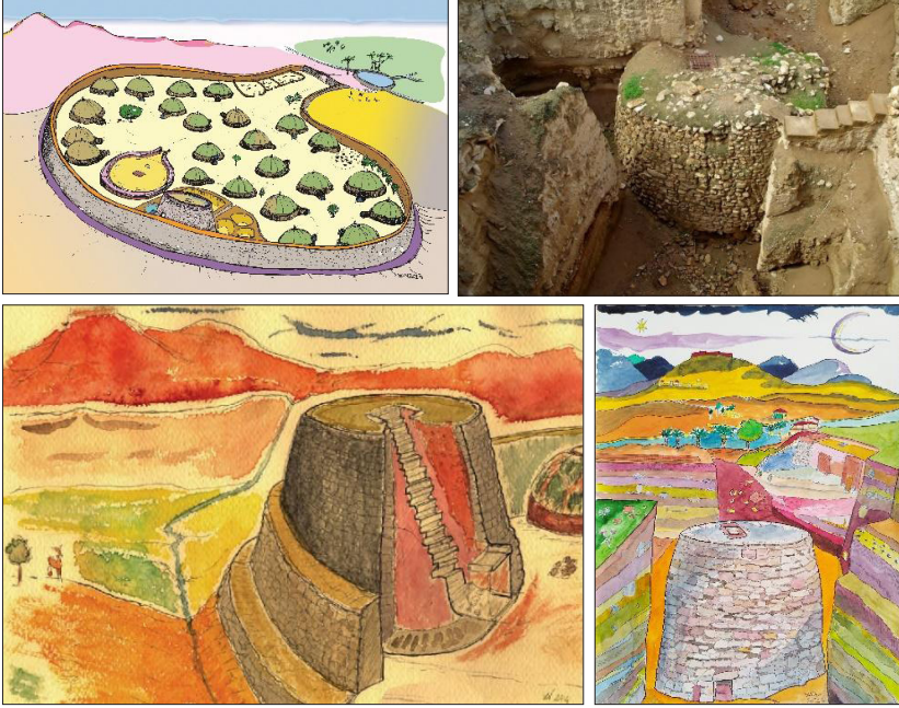
شكل 1: استنباء لواحة تل السلطان ولأقدم برج دفاعي في العالم وجد في تل السلطان/ أريحا (رسم Lorenzo Nigro وبإذن منه) (1)

كما أنه وفي حالات خاصة في العصر الحديدي الثاني، بُنيت أسوار مزدوجة (Case - mate Walls) أو بُنيت منحدرات زلقة تلتصق بالسور، وتنتهي نهايتها بخندق (Glacis)، ويعتقد أن وظيفة هذا النوع من التحصينات هو عدم تمكين العربات من الوصول للأسوار الدفاعية، وكذلك عدم تمكين المنجنيقات من ضرب الأسوار. وللتعرف على أمثلة على الأسوار في العصور الحديدية (1200 - 586 قبل الميلاد) في فلسطين، علينا مراجعة نتائج الحفريات الأثرية التي جرت في دير البلح وتل العجول وتل الدوير وتل المتسلم (مجدو) وتل بيسان وتل وقاص (شكل 2) في فلسطين (Yadin 1968: 50 - 71; 1963: 287 - 290; 1958: 2 - 21).