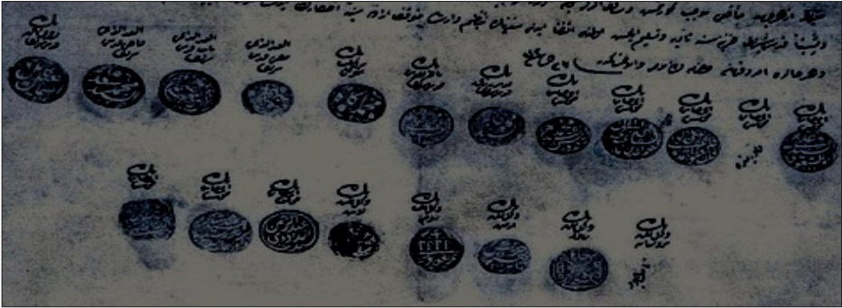
توابع وأختام الموقعين على بيع حمامي خاصكي سلطان

وبعد إخبار لجنة الكشف عن طريق الشهادة وطلب الوكيل المذكور إجراء الإيجاب اللازم بموجب وكالته، إلا أن إجراءه متوقف على الحصول على الإرادة السنية، لذا أرفعه لسريكم العالي وباقي الأمر لمن له الأمر. تحريراً في اليوم الخامس والعشرين من سنة اثنين وسبعين ومائتين وألف (1855). أحمد بك محمد سعد القاضي بالقدس» (1) .