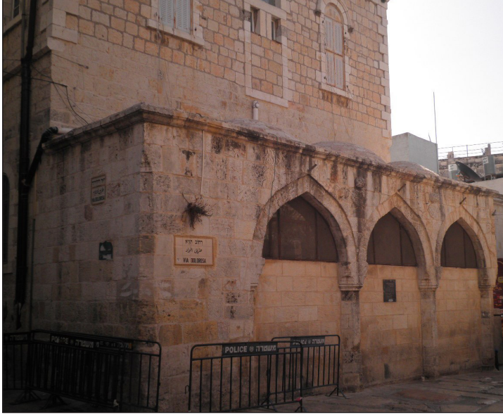
الواجهة الغربية المتبقية من حمامي خاصكي سلطان