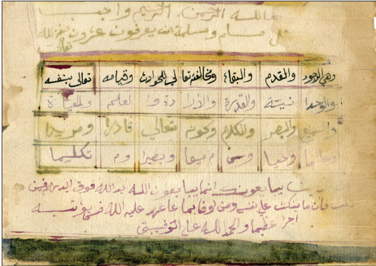
(شكل رقم 3)

يلي ذلك فاصل ملون باللون الأخضر الغامق بعرض 2 سم. ثم مقدمة نص الإجازة.