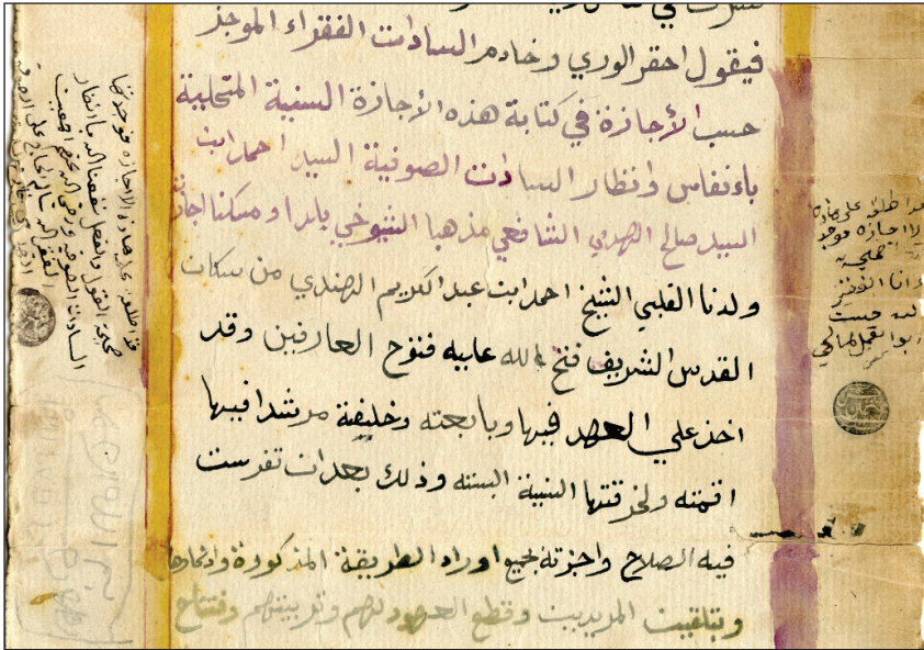
(شكل رقم 4)