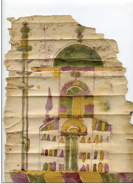
(شكل رقم 1)