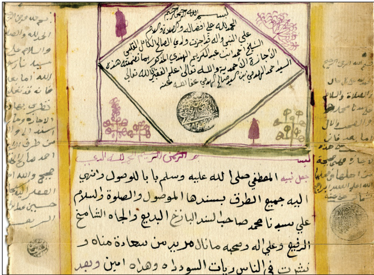
(شكل رقم 5)