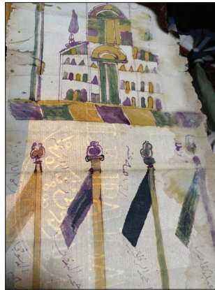
(صورة العلامة المائية)

كُتبت الإجازة على ورق عالي الجودة مصنوع يدوياً في أوروبا، ويمكن رؤية العلامة المائية (صورة العلامة المائية أدناه) بشكل واضح تحت الرسومات بتعريضها للضوء، إذ تظهر على شكل ختم يوجد بداخله كتابة بالأحرف اللاتينية LAPALZONI وتتبعها كتابة بالأحرف العربية (لابلزوني لأكوستا). أثناء دراسة المخطوطة استعنت بمركز المخطوطات في الحرم القدسي الشريف لتحديد نوع الورق والحبر المستخدمين بعد قيامهم بمعاينة صور المخطوطة. تظهر على المخطوطة أربعة خطوط للسادات الصوفية الذين صادقوا على الوثيقة، وتحمل أختامهم، بما يشير إلى أن هذه الشهادات قد كُتبت بخط أيديهم بالحبر الأسود وواحدة منها باللون البنفسجي.