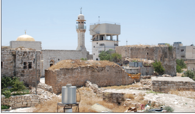
البلدة القديمة في الشيوخ ويظهر فيها مسجد الهدمي

عاش الشيخ أحمد صالح الهدمي في القرن التاسع عشر، ويشير تاريخ الختم على الإجازة إلى سنة 1282 هجرية، الموافق 1865 ميلادية. لا بد وأن الشيخ أحمد كان في عمر متقدم، ويمكن الاستنتاج أن والده الشيخ صالح قد وُلد في أواخر القرن الثامن عشر وعاش حياته في بداية القرن التاسع عشر. وتقيم عائلة الهدمي في بلدي الشيوخ وشيوخ العروب، وانتشر أبناء العائلة في مناطق مختلفة، ويمثل الشيخ أحمد الهدمي ابن الشيخ صالح الهدمي الجد السابع لعائلة الهدمي الحالية.