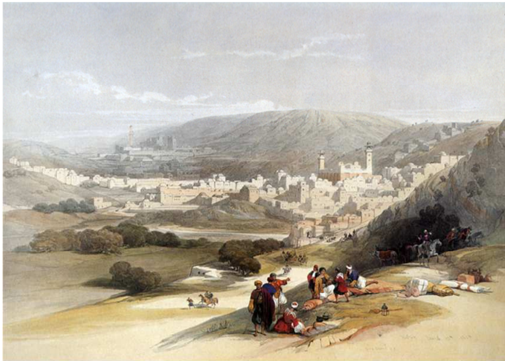
Hebron by David Roberts