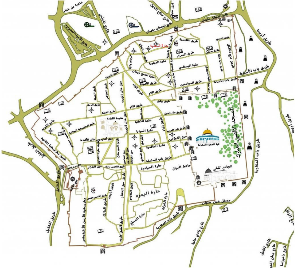
خارطة رقم (1) موقع حارة بني زيد داخل سور مدينة القدس وتقع بين باب العامود وباب الساهرة