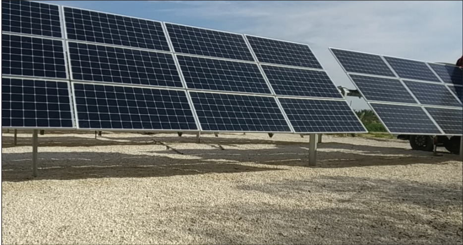
الخلايا الشمسية التابعة للمشروع الإنشائي - زيارة للمشروع: بتاريخ 2020 / 1 / 27

كما يستقبل المشروع طلبة من كليات الزراعة في منطقة العروب قضاء الخليل، ومن جامعة النجاح الوطنية في مدينة نابلس، ومن جامعة الاستقلال في أريحا، ومع جمعيات تعنى بالإنتاج الزراعي والحيواني مثلاً، ولجان العمل الزراعي ومجموعة الهيدرولوجيين، ويعمل المشروع في مجال استثمار الطاقة الشمسية التي أفرد لها خمسة دونات وهي حالياً تسد ربع إنتاج المشروع من الطاقة الكهربائية، ويجري التعاون مع مركز الأبحاث للاستثمار في مجال المياه العادمة، وإنتاج نوعيات محسّنة من النخيل وعلف الحيوانات الزراعي، ويركز حالياً على تربية الأبقار، ومصانع الألبان، ومشروع تفريخ الأسماك.