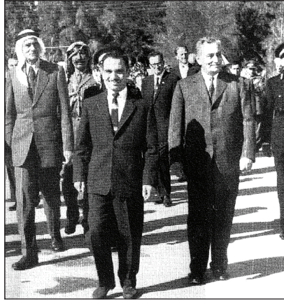
الملك الراحل الحسين بن طلال وبجواره موسى العلمي في زيارة للمشروع عام 1955م

وقام العلميّ بالترويج لقصة النجاح هذه محلياً وعربياً وعالمياً أيضاً، وحصل على تبرعات من جهات عدّة بعد أن قدّموا وشاهدوا قصة النجاح هذه بأب أعينهم، لقد تبرع له الملك الراحل الحسين بن طلال عام 1966م بمبالغ ساهمت في سد العجز المالي الناتج عن التوسع في زراعة الخضار والأشجار المثمرة، ومزارع الدواجن والأبقار (1) ، وتبرعت مؤسسة فورد العالمية مرات عدة لدعم المشروع وتطوير أعماله، وتناقلت أخباره الصحافة العالمية والعربية، وبعد مرور خمس سنوات على المشروع أصبح يضم ألف لاجئ ويعيل عشرة آلاف نسمة، ويربي ويعلم (200) يتيم، وأشادت بعثة البنك الدولي للإنشاء والتعمير في تقرير التطور الاقتصادي في الأردن لعام 1957م بما تقوم به جمعية المشروع الإنشائي العربي في حقل التعليم الزراعي، وفي تطوير وسائل الرّي الفنية، واستصلاح الأراضي المالحة، وإنتاج الحبوب وعلف الحيوانات، وزراعة الأشجار المثمرة والخضار وتحسينها، وتربية الدواجن والأغنام والأبقار، وصناعة الألبان (2) .