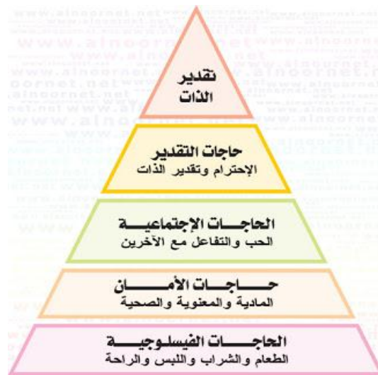
الشكل رقم (1) يمثل هرم ماسلو للحاجات

ذكر العزاوي وآخرون (2010) أن هذه النظرية من أقدم النظريات التي فسرت الحاجات، حيث رتب ماسلو الحاجات الإنسانية على شكل هرم تمثل قاعدته الحاجات الفسيولوجية الأساسية، وتدرج تلك الحاجات ارتفاعاً حتى تصل إلى قمة الهرم حيث حاجات تحقيق الذات، ولا يمكن الانتقال إلى حاجة أعلى قبل إشباع الحاجة الأقل.