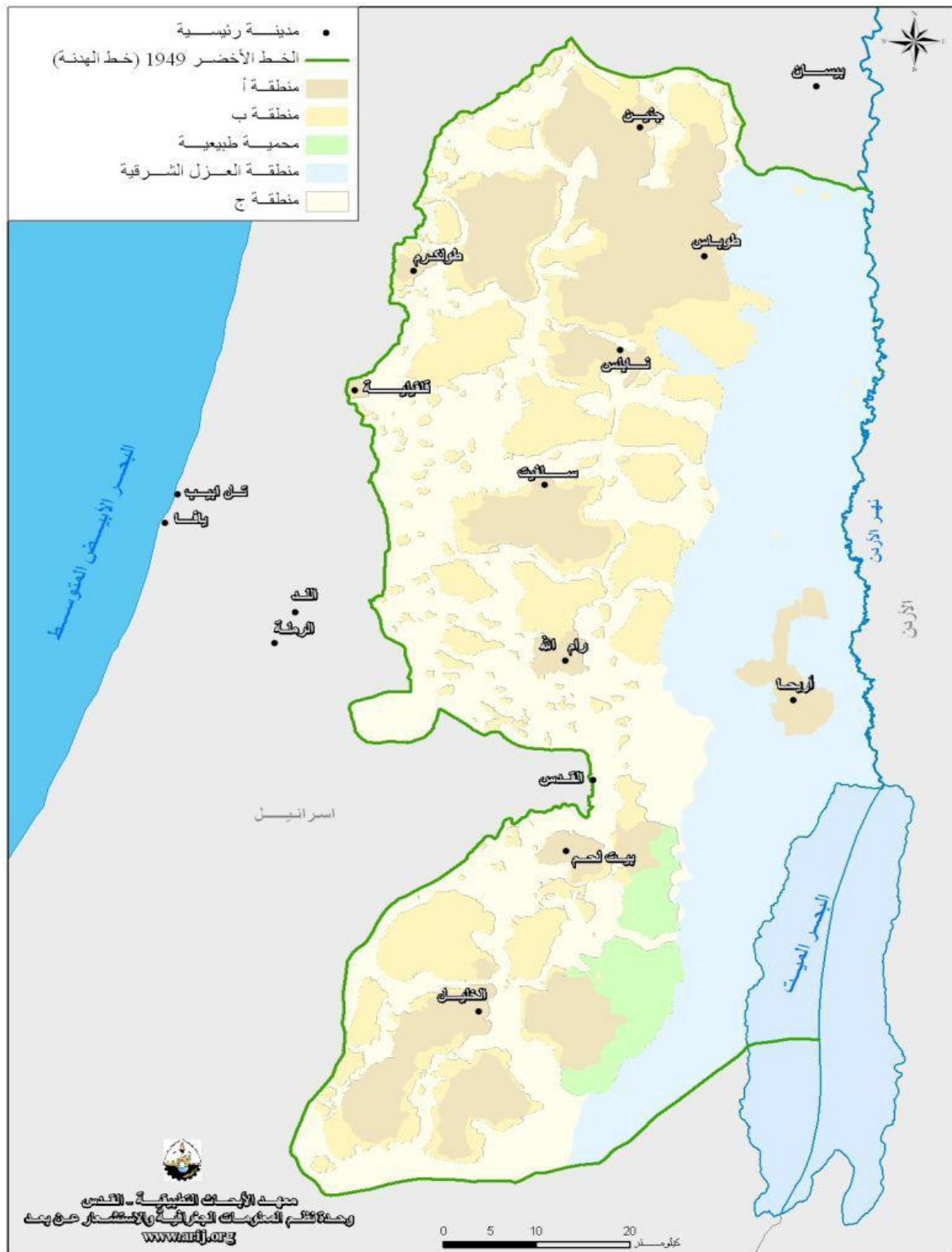
شكل 1.2 خريطة توضح مدن الضفة الغربية (معهد الأبحاث التطبيقية أريج، 2012)

للجماعات البشرية منذ القدم ، وهي رقعة تتمتع بموقع بؤري يجذب إليه - لأهميته - كل من يرغب في الاستقرار والعيش الرغيد.